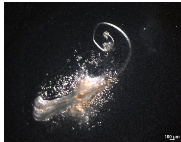
図2 第3の細胞により生体外培養で再生した毛包

オーガントックからコージンバイオへのライセンス供与は、三次元人工皮膚に次いで2事業目となります。毛髪を生み出す「毛包器官」の再生には毛包上皮性幹細胞と毛乳頭細胞が重要な役割を果たしています。オーガントックは、2026年2月に、世界に先駆けて毛包器官再生を誘導する「第3の細胞」である「毛包再生支持細胞」を発見しました（*）。一方、コージンバイオは、毛包器官に由来する毛乳頭細胞および毛包再生支持細胞の培養を可能とする高性能培養液の販売を進めてきました。